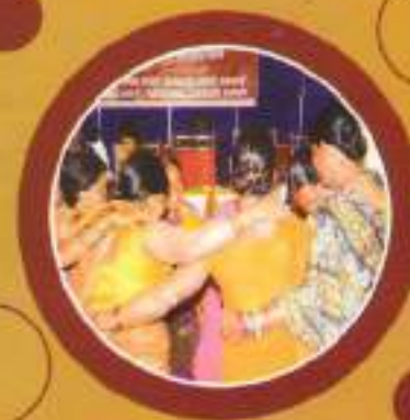
ଭଗ୍ନାମଣ୍ଡଳି (ଇଉଣୀ ମେଳ)ର ପ୍ରସାର ଓ ମିଳିତ ଶକ୍ତି ନିର୍ମାଣ